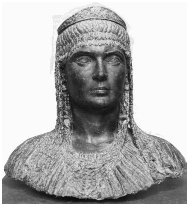
Εικ. 1. Μπρούτζινη προτομή της Σοφίας Σλήμαν, Γεώργιος Καστριώτης, 1933, Δημοτική Πινακοθήκη Πειραιά.

Παρά την απόφαση της οικογένειας της Σοφίας, ο Καστριώτης τελικά θα ασχοληθεί με την προτομή της αγαπημένης του θείας, εκπληρώνοντας κατ' αυτόν τον τρόπο την επιθυμία της. Το 1933 θα κατασκευάσει μία μπρούτζινη προτομή της Σοφίας, η οποία φέρει το διάδημα της Τροίας (Εικ. 1). Ο ίδιος έλεγε: «όταν φιλοτεχνούσα την προτομή της θείας Σοφίας με το διάδημα της Τροίας μελετούσα, όχι μόνον την φωτογραφία που τη δείχνει να το φορεί αλλά κι ένα μικρό τεμάχιο από