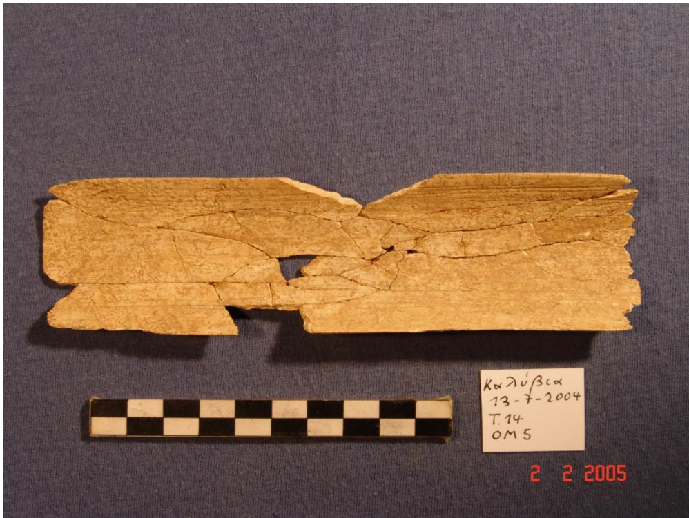
Εικ. 1 Οστέινο πινάκιο (παλέττα) από τον τάφο 14 του ΠΕ Ι νεκροταφείου της Αρχαίας Ήλιδας. Fig. 1 Bone palette from tomb 14 at the EC I Ancient Elis cemetery.