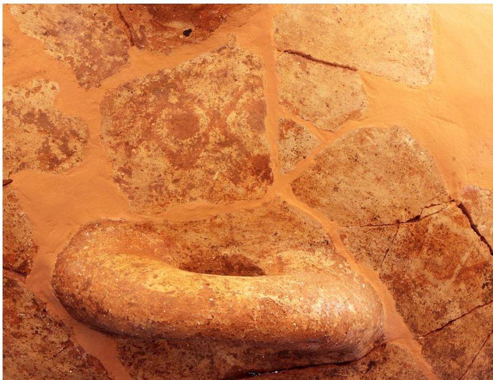
Εικ.2 Γραπτό κυκλαδικό διακοσμητικό θέμα (συνεχόμενοι ρόμβοι) σε υπερμεγέθη κύμβα από τον ΠΕ ΙΙ οικισμό του Ρωμανού. Fig. 2 Painted Cycladic motif (continuous rhomboids) on an oversized sauceboat from the Early Helladic II Romanos settlement.