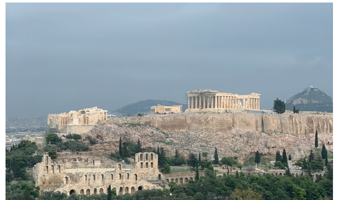
Akropolis, Athen.

Året 2010 dök ett oväntat föremål upp i Hellvi socken på Gotland – en romersk kavallerimask från 100-talet e. Kr. – som flera hundra år senare hade blivit omgjord till ett kultobjekt. Med sitt grekiska och romerska symbolspråk avslöjar masken historien bakom resan från en religion och kultur till en annan.