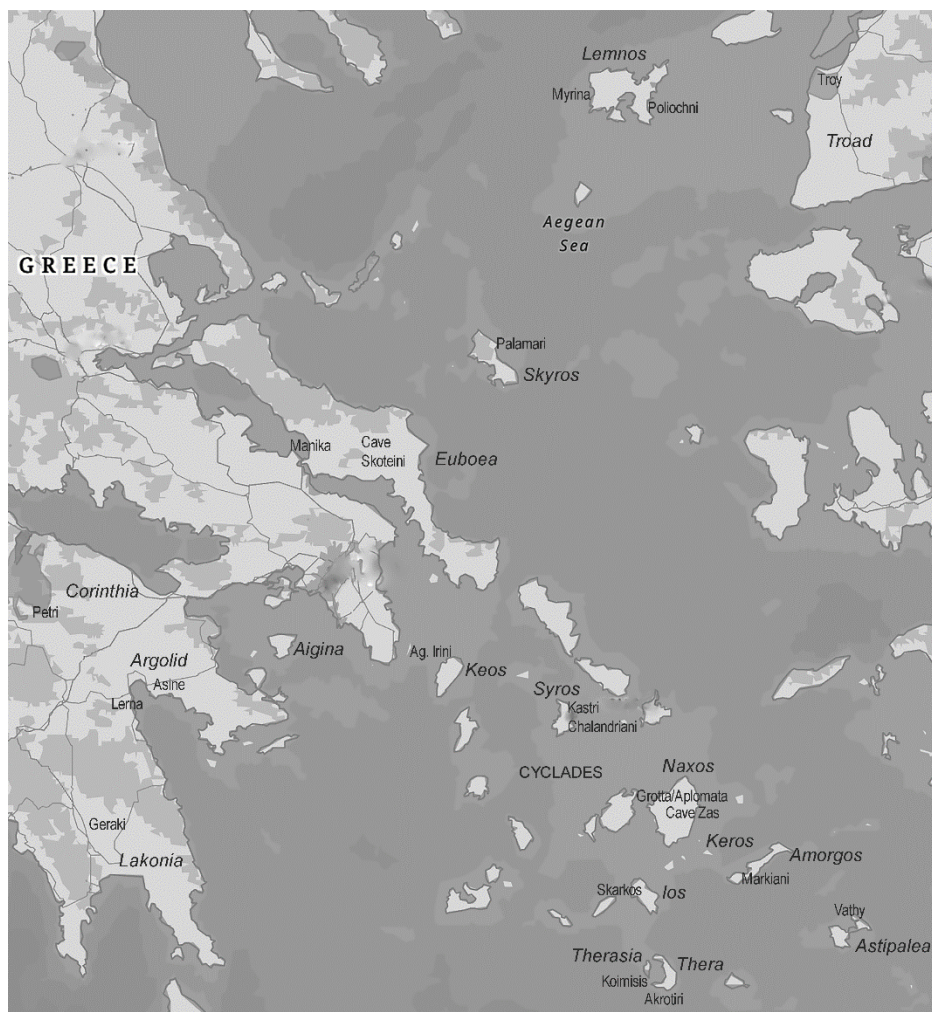
Fig. 2 Early Bronze Age Aegean sites with seals, sealings and stamped impressions on pottery and weights Εικ. 2 Αιγαιακές θέσεις της Πρώιμης Εποχής του Χαλκού με σφραγίδες, σφραγίσματα και αποτυπώματα σφραγίδων σε αγγεία και υφαντικά βάρη

Εικ.1 Λαβή αγγείου της Πρωτοκυκλαδικής ΙΙ περιόδου από τον οικισμό της Κοίμησης στη Θηρασία με αποτυπώματα σφραγίδων και άποψη του χώρου εύρεσης